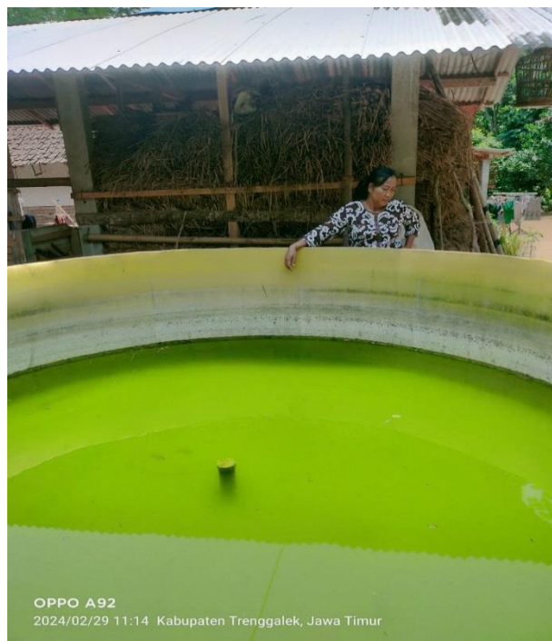
Gambar 2. Kondisi Salah satu kolam penerima bantuan APP Kabupaten Tahun 2019 Pokdakan Jiwo Sawiji