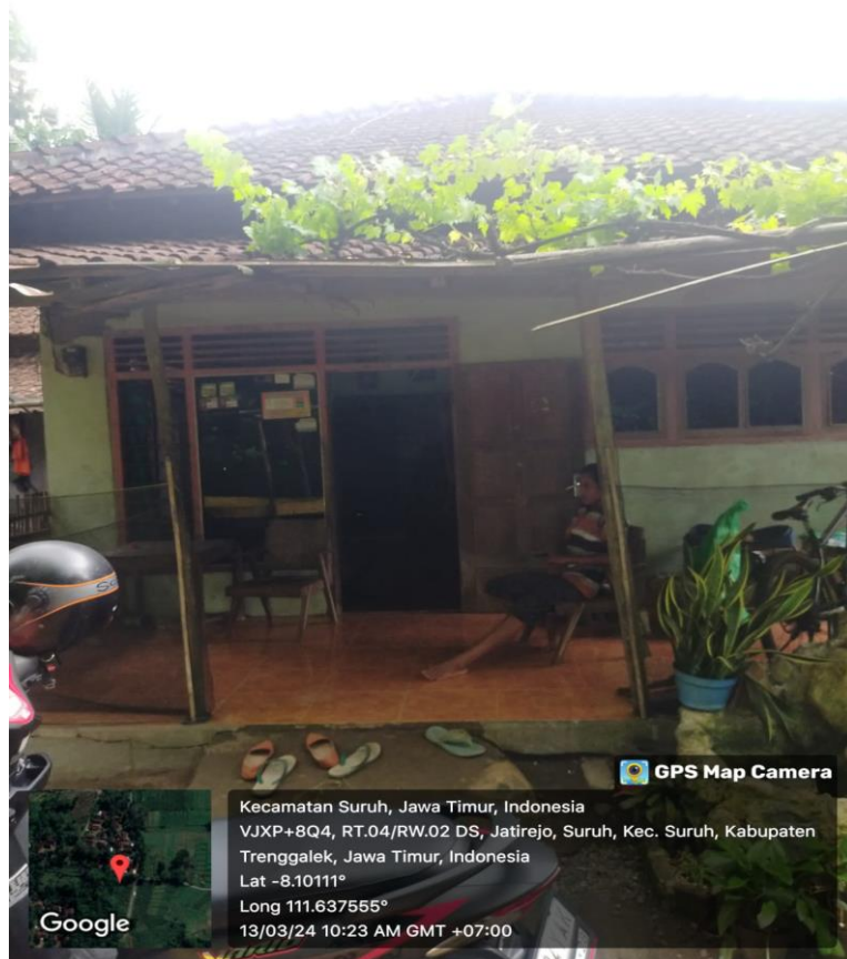
Gambar 1. Titik koordinat lokasi rumah ketua Pokdakan Jiwo Sawiji yaitu Pak Gunawan