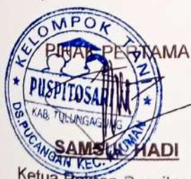
Ketua Poktan Puspitosari II

Demikian surat kerjasama ini dibuat untuk digunakan sesuai kebutuhan.